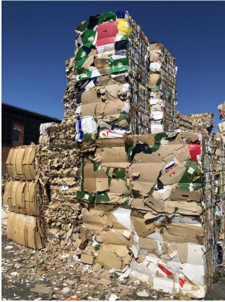
Studiebesök på pappersbruket i Röpina, 10 mil utanför Tartu