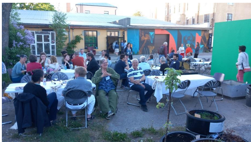
Samkväm utanför TYPAs verkstad första kvällen