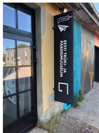
TYPAs – Estlands tryck- och pappersmuseum

Under tre dagar träffades cirka 70 representanter för tryckerimuseer från 18 länder i Tartu i Estland, en trevlig stad med runt 100 000 invånare, och många byggnader från den gamla Sovjettiden stod