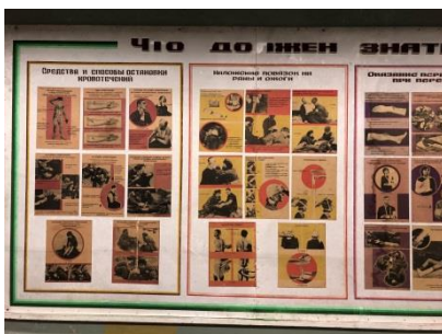
Affischer i konferenssalen – också detta ett minne från Sovjettiden