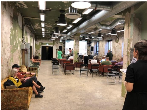
Konferensrummet, en kvarleva från Sovjettiden, fotat taget första dagen, innan alla var på plats och föreläsningarna kommit igång.

Vi blev väl mottagna till ett välorganiserat, 3-dagars arrangemang och ett gediget program med intressanta föredragshållare. Här kan vi nämna Det Underjordiska Tryckerimuseet i Litauen, The Underground Printing Museum (med hemlig signatur på trycksakerna "AB"), som lyckades hålla sin verksamhet dold för KGB; Aimur Takk, typsnittsdesigner och konstruktör av trästil enligt gammal Estnisk teknik, där stilen kan säras/delas; Rapport om linotypeutbildningen som Pressemuseet i Röros, Norge haft i samarbete med Museum für Druckkunst i Leipzig; Presentation av Maarten Renckens projekt linotype.wiki där han strävar efter att sammanställa var i världen samtliga Linotype- Intertype- Typograph- Monotype- och Ludlow-maskiner finns och vilka som kan reparera dessa; bland mycket annat. Fokus för föreläsningarna låg främst på Östeuropa och Skandinavien.