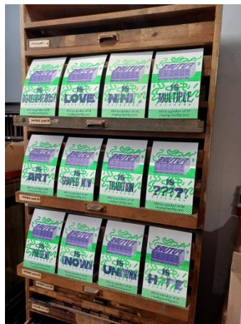
Tryck från workshopen – "FUTURE IS [egensatt ord] This is a product of AI (Analog Intelligence)"