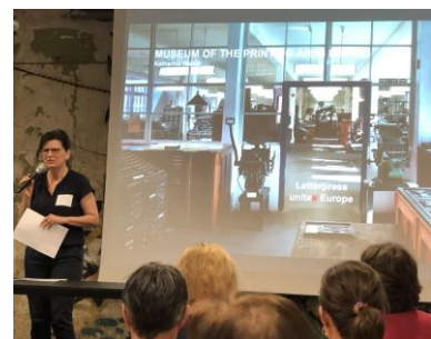
Föreläsare från Museum of the printing arts Leipzig