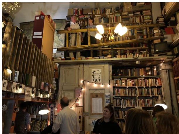
Bokhandeln för begagnade, billiga böcker, Fahrenheit 451