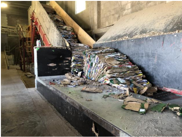
Pappersbruket i Röpina