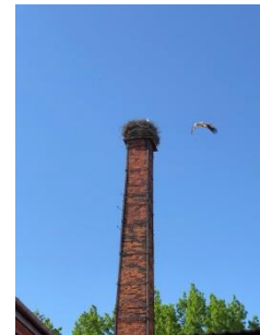
Höjdpunkter „ trevligt med många häckande storkar ute på landsbygden