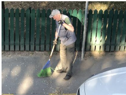
Gatsoppare. Något som inte är synligt i gatubilden i Sverige numera, men som sågs sopande trottoarerna, morgnar och kvällar i Tartu.

klar och delade plats med det helt moderna. Känslan var på många ställen lite som att ha vridit klockan tillbaka till det gamla Sverige.