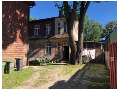
Vissa hus gav en känsla av det gamla Sverige – med tvätten hängande på torklina utanför