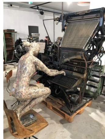
Lino-Monotypeing ?? ,,