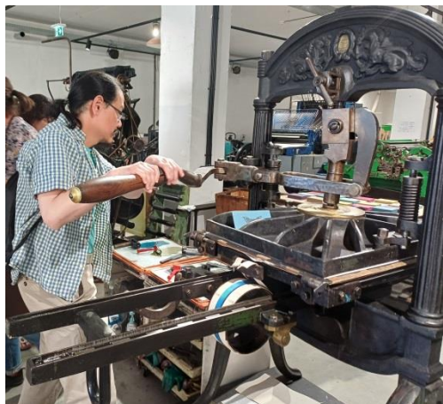
En Christian Dingler-handpress i TYPÄs verkstad

TYPÄ är ett tryckerimuseum med pappers- och konstnärsvrkstad som startades 2010 och som sedan starten har varit tvungna att flytta till nya lokaler två gånger, och fortsatt inte har något fast kontrakt för den nuvarande lokalen, en gammal apparatfabrik, utan därför låter tryckpressar och övriga maskiner stå kvar på lastpallar – för att vara redo om en ny flytt skulle bli nödvändig.