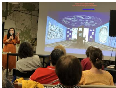
Föreläsare från Museum of Book and Printing of Ukraine