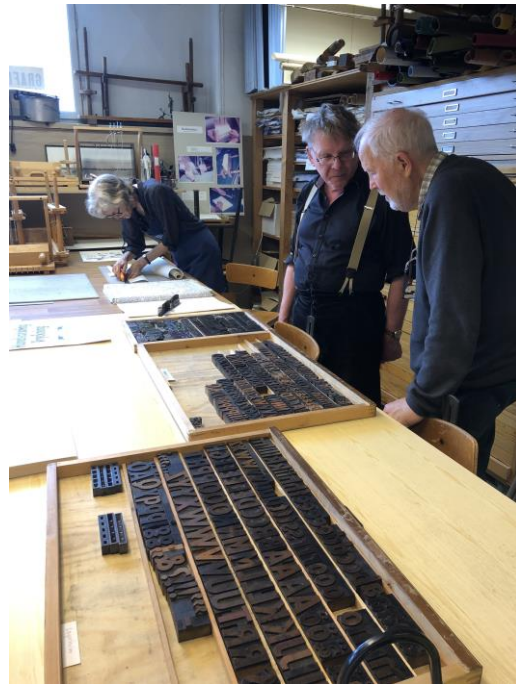
Diskussion med stil